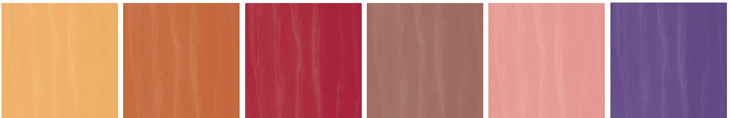
EGYPTIAN YELLOW 455