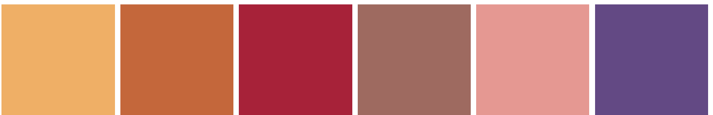
EGYPTIAN YELLOW 450